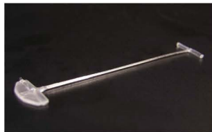
FINE (BĚŽNÁ KVALITA) Splinty s dvojitou hustotou. Délky 7–75 mm