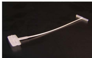
STANDARD (BĚŽNÉ) Splinty běžné kvality Délky 15–125 mm