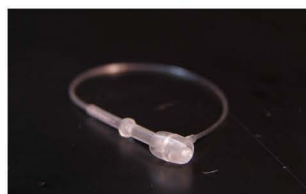
TWINLOCK v délkách: 50, 75, 125, 175 a 225 mm