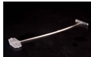
STANDARD (MICRO) Splinty běžné kvality Délky 15–75 mm