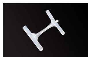
FINE BANOK T-END Splinty se zvýšenou pevností Délky 5–11 mm