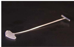
FINE BANOK (ZNAČKOVÉ) Splinty s dvojitou hustotou. Délky 5–65 mm